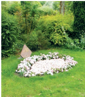
Jardin des Anges

Après la crémation, les cendres sont dispersées au cimetière du Parc, dans le secteur "Les Saules", à proximité du crématorium. Une stèle marquée Jardin des Anges symbolise le lieu.